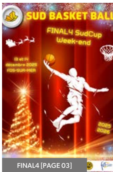
FINAL4 [PAGE 03]