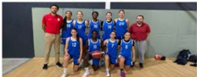
SÉLECTION S.U15 SUD-EST