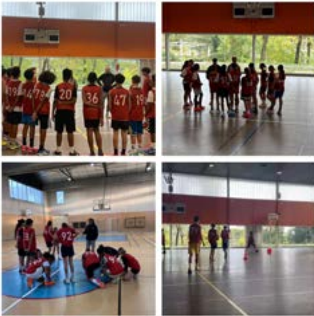
STAGIAIRES CICU13 OCTOBRE 2025

La Ligue SUD Basket Ball et l'IRFBB SUD remercient l'ensemble de leurs partenaires institutionnels, techniques, ainsi que les clubs hôtes pour leur soutien constant à la formation, à l'insertion professionnelle et au développement des compétences sportives.