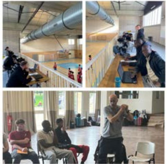
ANALYSE TERRAIN ET FORMATION TECHNIQUES DES BPJEPS