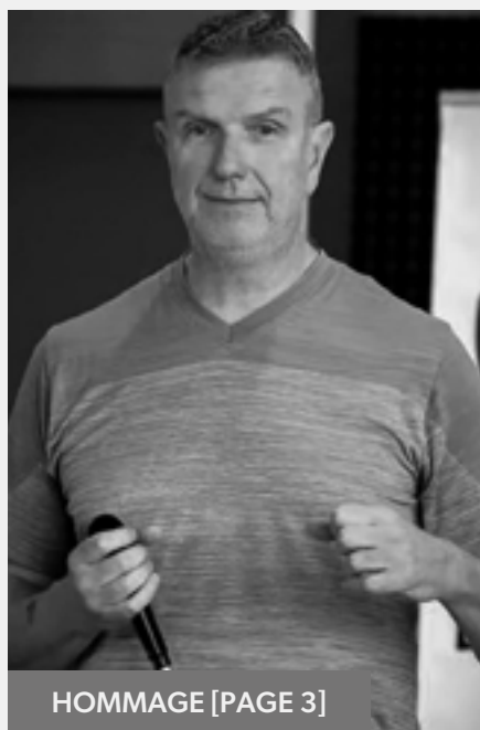
HOMMAGE [PAGE 3]